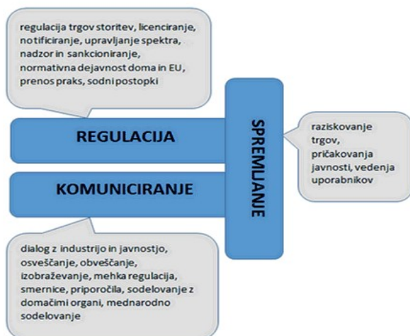
SLIKA 1: RAVNI DELOVANJA AGENCIJE PRI IZVAJANJU POSLANSTVA

Poslanstvo agencije je zagotavljanje učinkovitega razvoja komunikacijskih omrežij in storitev v korist prebivalcev in poslovnih subjektov Slovenije, spodbujanje konkurence, zagotavljanje enakopravnega delovanja operaterjev elektronskih komunikacijskih omrežij in storitev, izvajalcev poštne storitve ter prevoznih storitev v železniškem prometu, zagotavljanje ustrezne oblike univerzalne storitve, upravljanje radijskega frekvenčnega spektra in številkega prostora, nadzorovanje vsebin radijskih, televizijskih programov in avdiovizualnih medijskih storitev na zahtevo ter varovanje pravic uporabnikov storitev. Pri izvajanju svojega poslanstva agencija sledi področnim zakonom in na njihovi podlagi izdanim podzakonskim aktom, obenem pa sodeluje pri razvoju novih pristopov in spremembah zakonodaje, skrbi za prenos dobrih praks ter nudi strokovno podporo in obvešča pristojna ministrstva o zaznanih potrebah po prilagoditvi ureditve vprašanj iz njene pristojnosti.